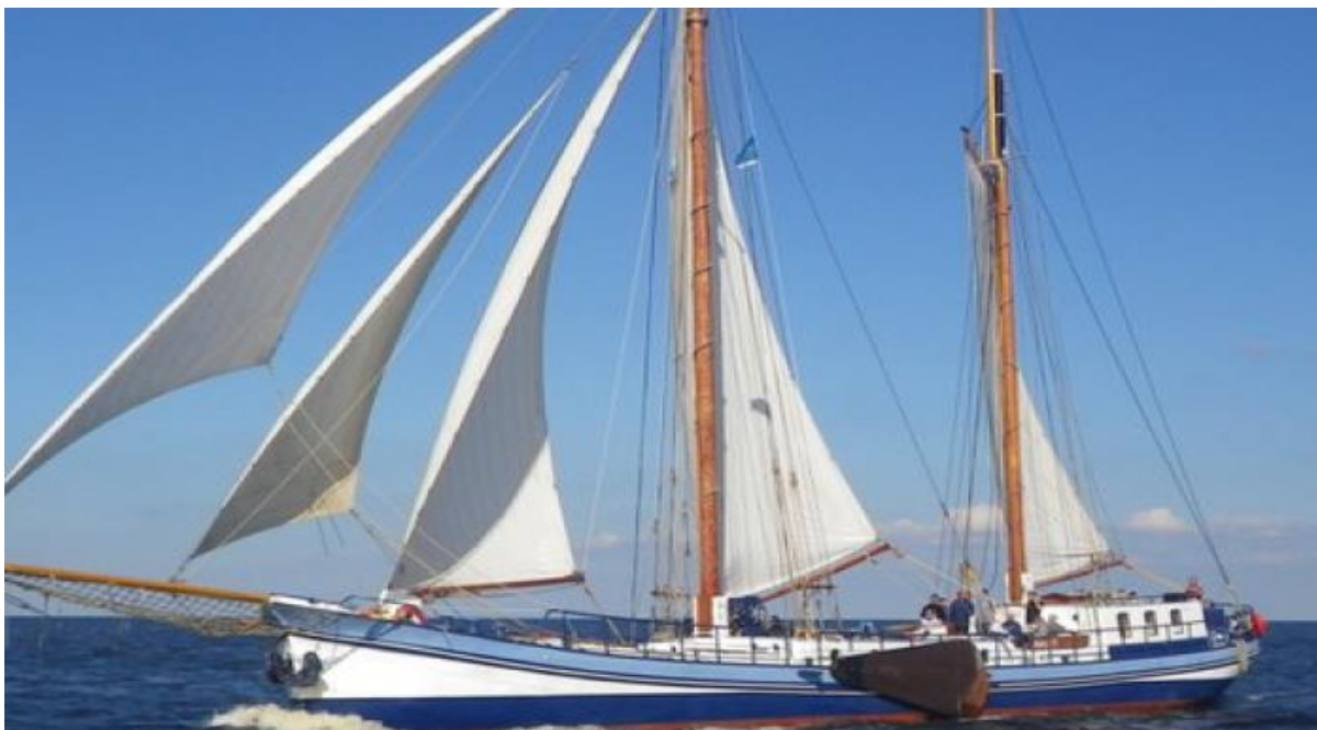
Zweimast Klipper Avanti, Länge 38m, mit 12 Doppelkabinen, 3 Duschen und 3 Toiletten