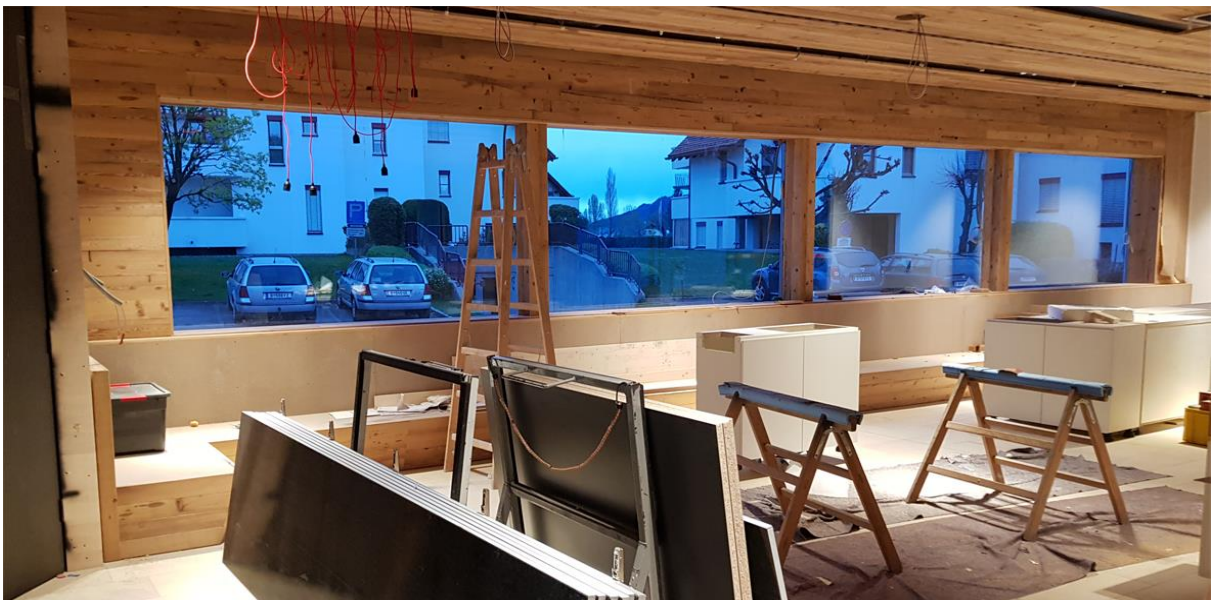
Umbau Gastraum Lamm, viel Holz in modernem Design

Der Schiffer-Gilde stehen dann leider nicht mehr die Zimmer direkt im Gasthof zur Verfügung, jedoch erhalten wir im gegenüberliegenden Gästehaus Inge 4 hochwertige Doppelzimmer mit eigenem Bad und TV.