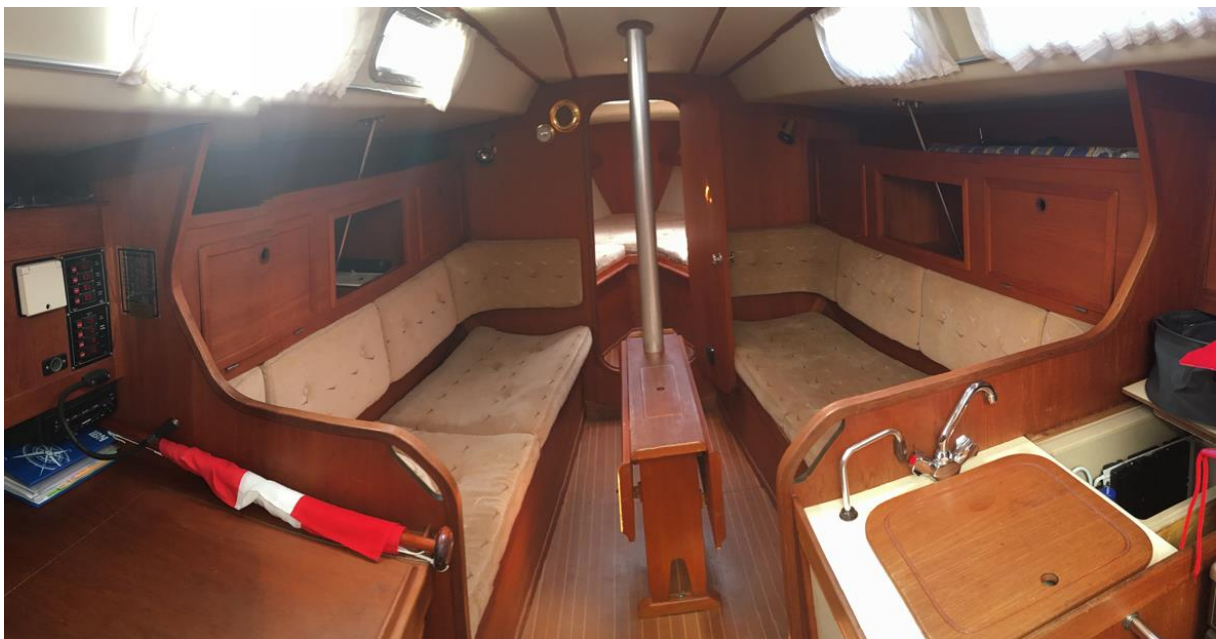
Innenansicht Sunwind 311 „Commodore II“

Die „Commodore II“ erhielt neue Segel und präsentiert sich in Top-Zustand.