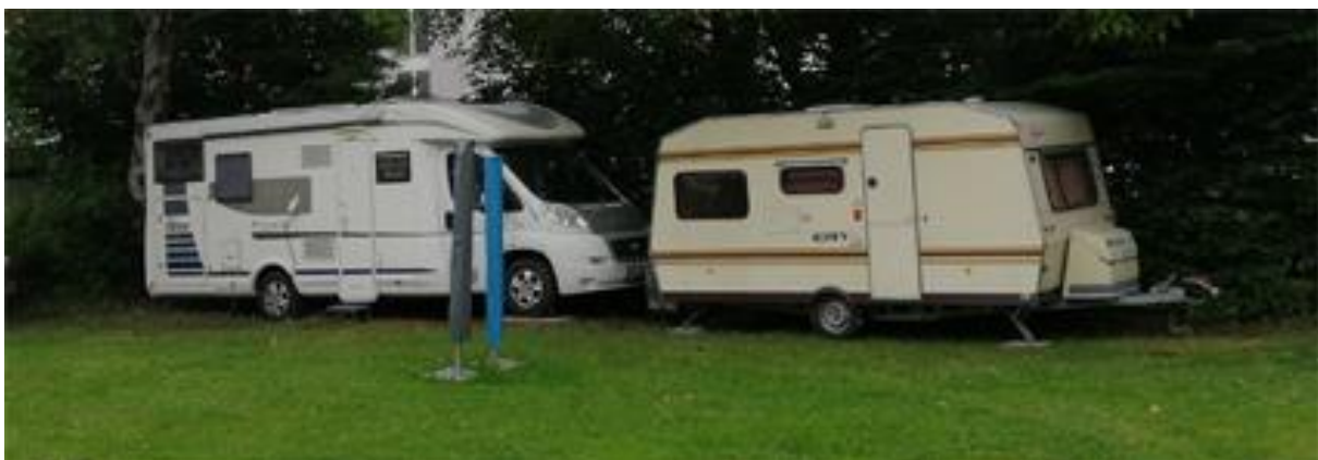
Ottos neuer Parkplatz am Bungalow

Unterstützt wird Otto in dieser Zeit von Studierenden aus Oldenburg, die so auch ihr Praktikum machen können. Deshalb haben die fleißigen Helfer unseren Wohnwagen aus dem Winterschlaf geweckt und dieser erhielt, wie auch Ottos Wohnmobil, einen Platz gegenüber vom Bungalow.