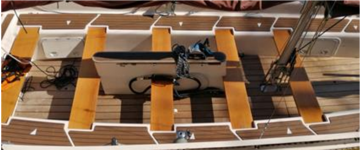
Die Zuversicht mit Platzmarkierungen

Dies geschieht in direkter Absprache mit Otto, unter den jeweils aktuell geltenden Hygiene- und Schutzmaßnahmen, da uns eure Sicherheit und Gesundheit wichtig ist (siehe Homepage).