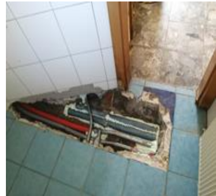
Wasserschaden im Bungalow-Bad

Sehr kurzfristig haben wir nun auch erfahren, dass der Bungalow aufgrund eines größeren Wasserschadens diese Saison überhaupt nicht genutzt werden kann (siehe Foto). Dies führt leider dazu, dass wir für spontane Besuche von Rollstuhlfahrer/Innen keine Übernachtungsmöglichkeiten anbieten können. Die Küche, wie auch unser Sitzplatz unter der Pergola kann aber genützt werden.